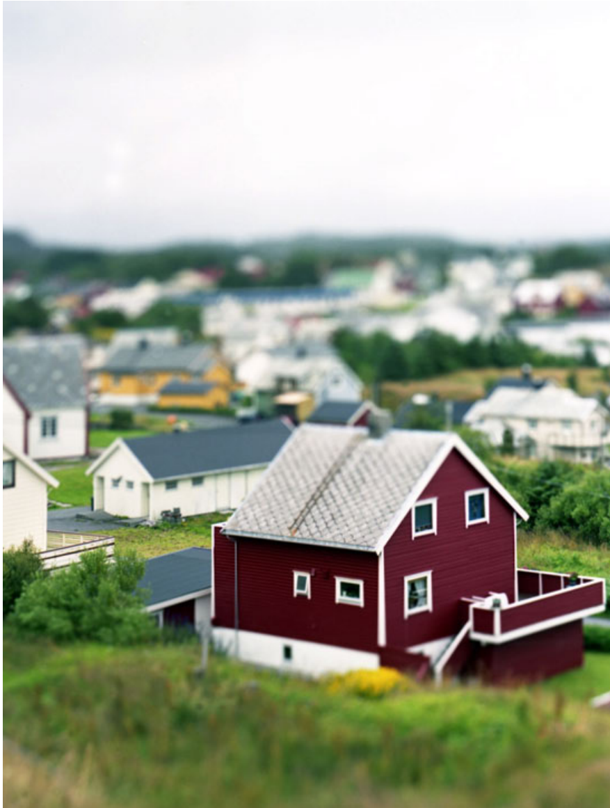
Motive aus der Serie: „play“